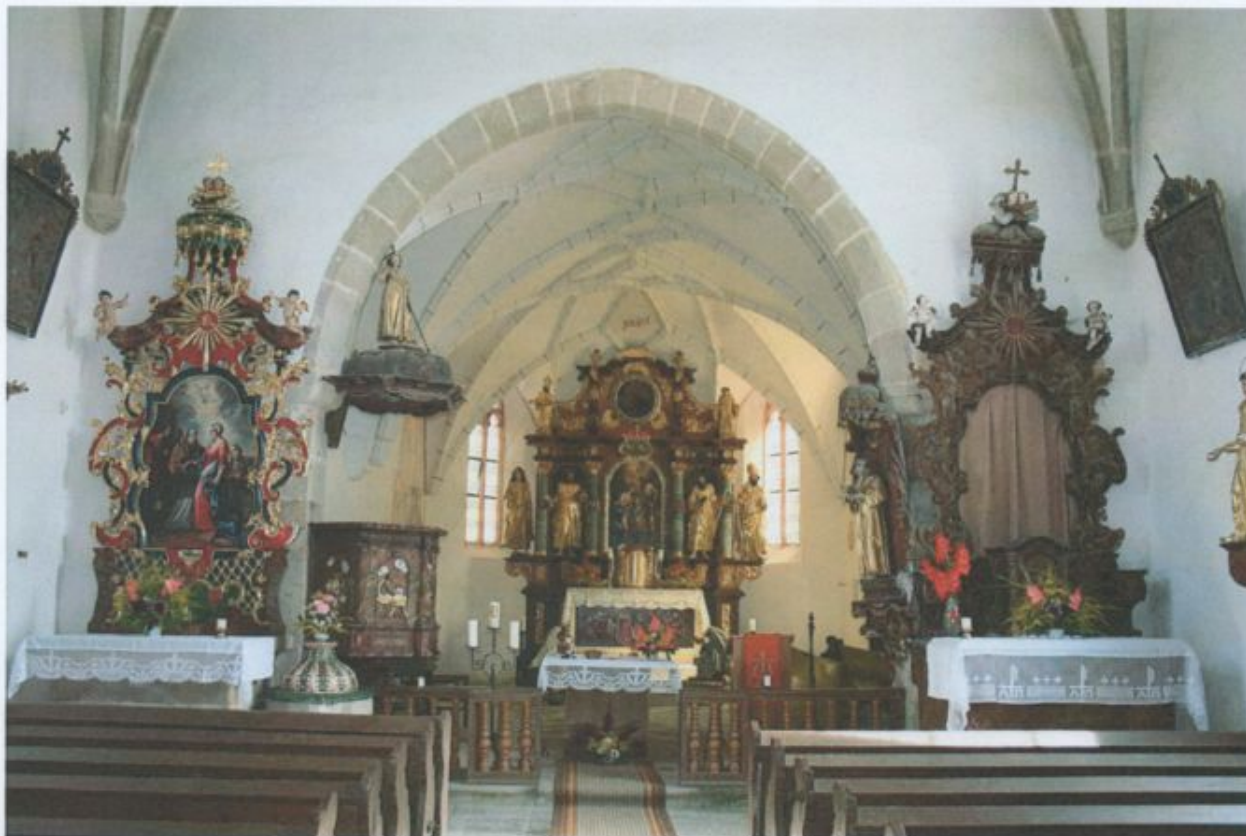
Oben: Blick in die Kirche mit dem restaurierten Hauptaltar und dem restaurierten linken Seitenaltar