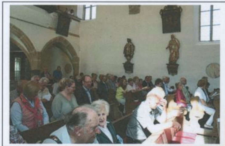
Links: Blick in den Kirchenraum beim Festgottesdienst im September d.J.